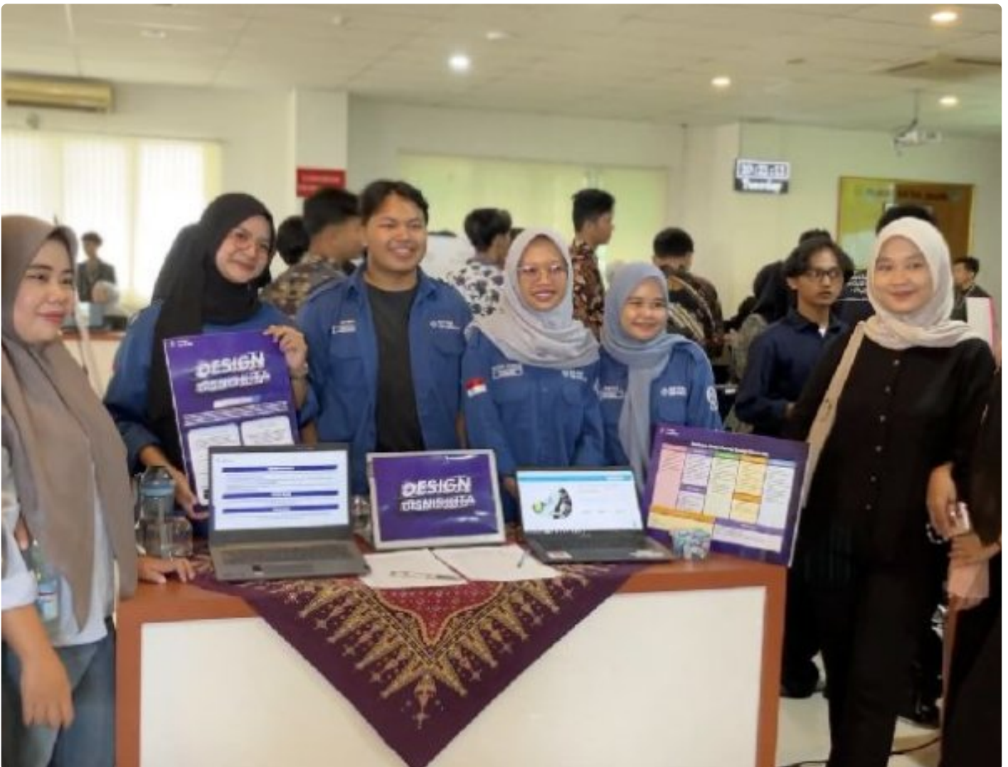
Technovation FTTI menampilkan Gelaran Karya Mahasiswa selama 2024 di Kampus 1 Unjaya, Selasa (24/12/2024)

Sleman - Fakultas Teknik dan Teknologi Informasi (FTTI) Universitas Jenderal Achmad Yani Yogyakarta (Unjaya) sukses menyelenggarakan Gelaran Karya